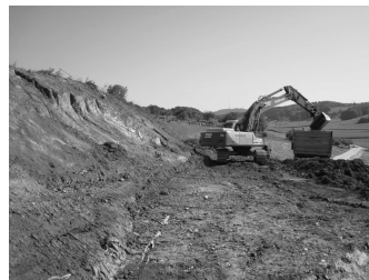
Abtragung der belasteten Materialien: