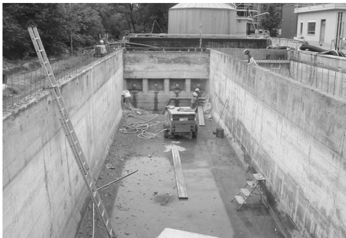
Mit dem Aufbetonieren wird das Volumen der alten Beckenblöcke erhöht.